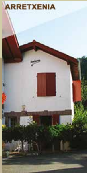
ARRETXENIA Le Gîte "Arretxenia" Avec 2 épis NN pour 4 personnes