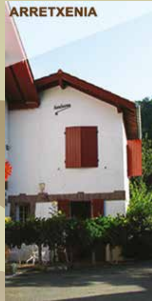
ARRETXENIA Le Gîte "Arretxenia" Avec 2 épis NN pour 4 personnes