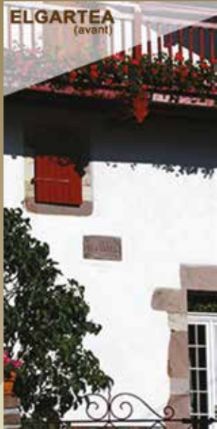
ELGARTEA (avant) Le Gîte "elgaratea"Avant Maison basque du XVIII siècle pour 8 personnes