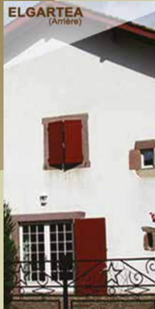
ELGARTEA (Arrière) Le Gîte "elgaratea"Arrière Authentique maison basque du XVIII siècle