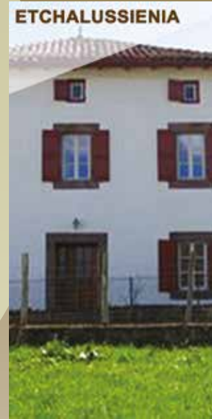
ETCHALUSSENIA Le Gîte "Etchalussenia" Avec 2 épis NN pour 12 personnes