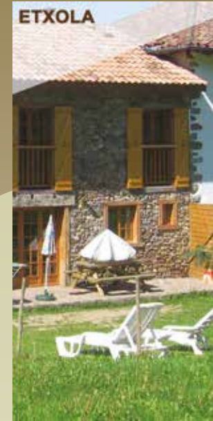
ETXOLA Le Gîte "Etxola" Capacité 6 personnes