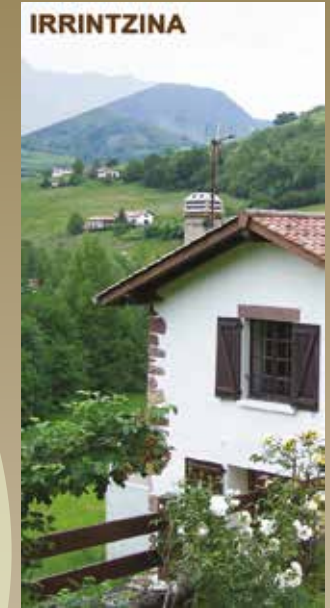
IRRINTZINA Le Gîte "Irrintzina" Capacité 10 personnes